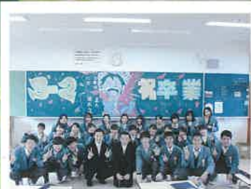
3月 卒業式 一般入学者選抜