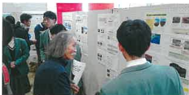
屋久島学ソサエティ(学会)発表の様子