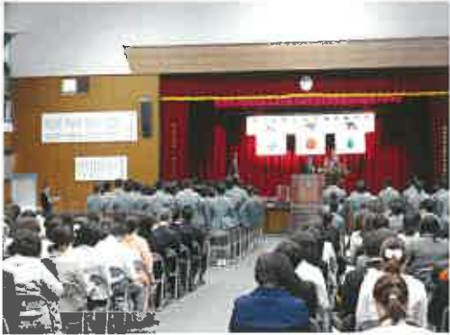
4月 始業式 入学式 新入生オリエンテーション