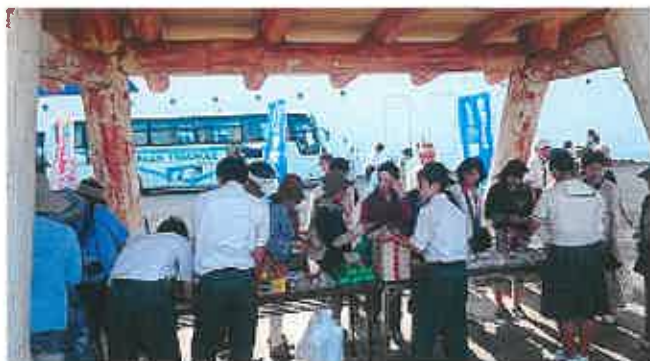
↑ クルーズ船おもてなしは情報ビジネス科伝統の活動です。

情報ビジネス科の特色を生かした活動や、観光地である屋久島だからこそできる活動もたくさん!!!