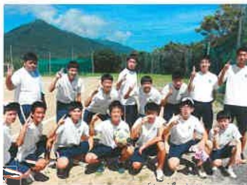
7月 インターンシップ(2年) クラスマッチ 中学生1日体験学習