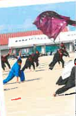
体育祭 伝統の ～