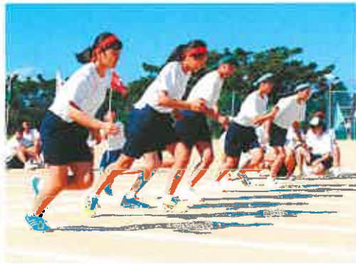
9月 体育祭 秋季地区大会 就職結団式