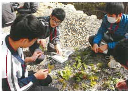
野外実習 (白谷雲水峡付近)