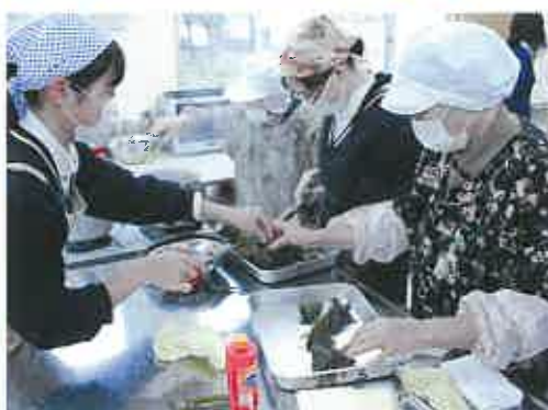
2月 環境コース郷土料理実習 国公立大学個別試験 就職進学合格体験発表会