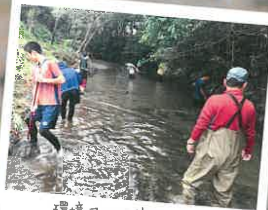
環境コース宿泊研修 地学・生物・公民(年3回実施) 野外活動実習もあります。