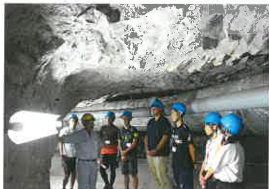
水力発電所内見学