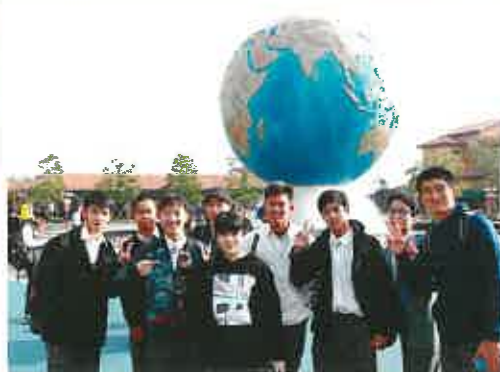
12月 2年生修学旅行 クラスマッチ 吹奏楽部定期演奏会