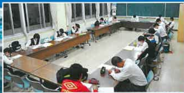
大規模改修により、校舎がとてもきれいになっています。 早朝・放課後や休日等は、冷暖房完備の会議室で自習をすることが出来ます。