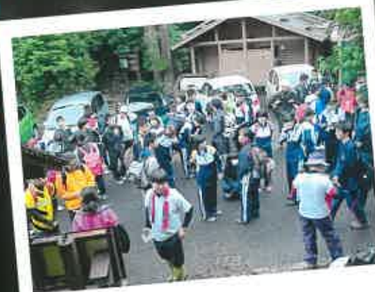
1学年全員による学校登山 屋久島ならではの行事です!