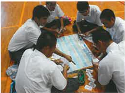
8月 夏季課外・進路学習 校内面接練習(就職・進学) PTA奉仕作業