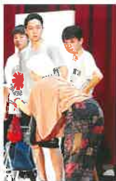
祭(2日間開催) ガイダンス 会役員改選