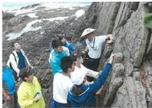
地学宿泊実習 (生痕化石調査)