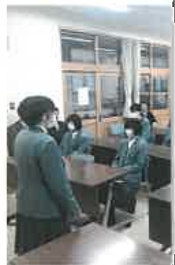
1月 セン セン 情報比