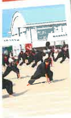
名物! 応援団演舞 土風靡～