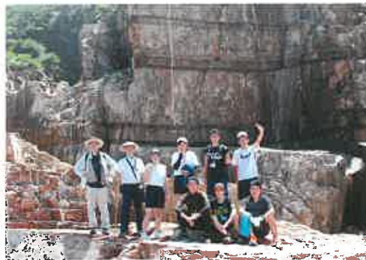
地学宿泊研修 (鉱山跡地見学)