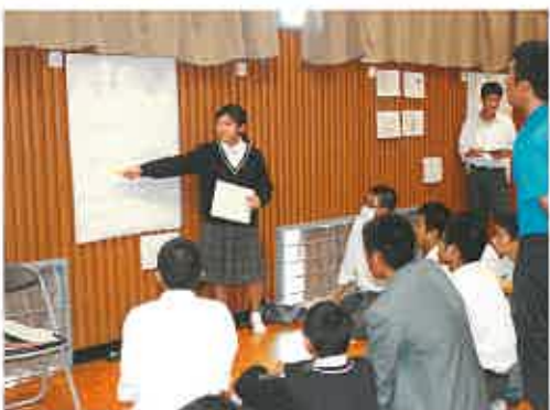
11月 環境コース課題研究発表会 生徒の活動報告会