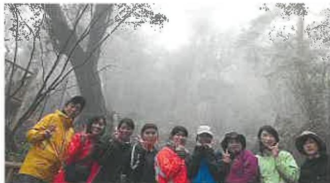
↑ 実習も盛り沢山! 観光産業について楽しく学習できます。