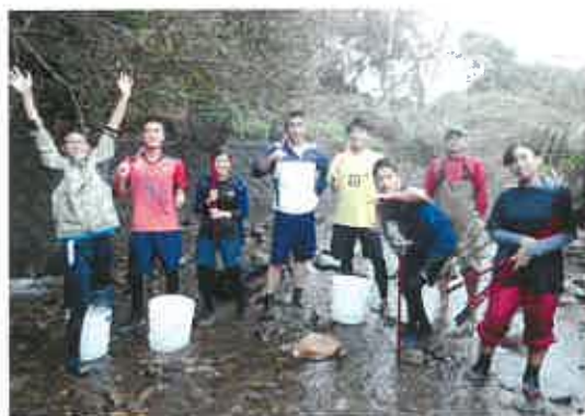
生物宿泊研修 (イテゴ川)