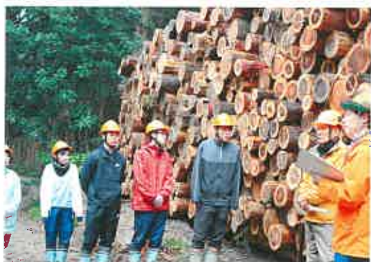
里巡り実習 (林業学習)