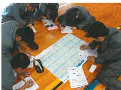
10月 職業ガイダンス 大学入試センター試験出願