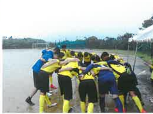
5月 春季地区大会 生徒総会 PTA総会