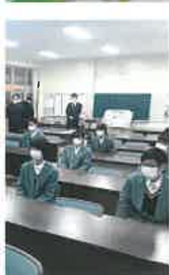
大学入試センター試験出願式 大学入試センター試験 化学科課題研究報告会