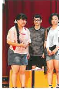
6月 文化 進路 生徒